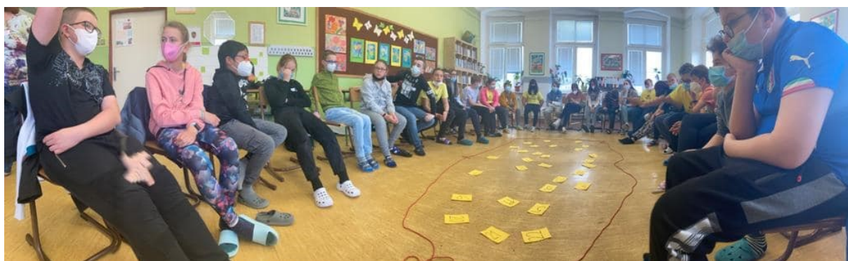
Obr. 10 – Adaptační kurz Odyssea v 6. ročníku

Těmto žákům je věnována individuální péče. Největší pozornost je zaměřena na osvojování českého jazyka. Všem žákům, kteří mají nedostatky v komunikaci písemné nebo ústní, byl sestaven individuální vzdělávací plán. Vše je konzultováno se zákonnými zástupci. 1 žákovi byl ve spolupráci s PPP Sokolov upraven obsah vzdělávání – v rámci rozvrhu hodin 3x týdně dochází na výuku českého jazyka (místo volitelných předmětů).