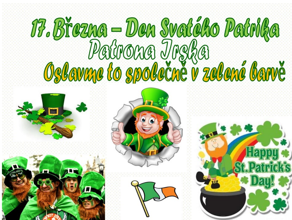
Obr. 16 – Pozvánka na on-line oslavu svátku svatého Patrika