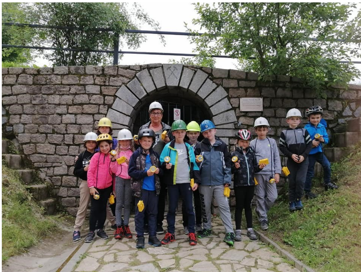
Obr. 7 – Příměstský tábor Výpravy za dobrodružstvím II

Ve škole se snažíme cíleně pracovat s talentovanými - nadanými žáky a se žáky se zájmem. Ve vyučování jsou voleny takové učební strategie, které jim umožňují osobnostní rozvoj ve prospěch jejich osobnostního maxima. Škola má v současné době diagnostikované tři žáky s nadáním (2 na 2. stupni, 1 na 1. stupni), z toho jednoho mimořádně nadaného – všichni technického a přírodovědného směru. Dva žáci měli ve školním roce 2020/2021 možnost setkávání v rámci podpůrných opatření s vyučující přírodopisu Mgr. Měřínskou a rozšiřování si znalostí. Žák 2. ročníku navštěvoval hodiny matematiky ve 3. ročníku. Významná je spolupráce s psychologkou školy a rodičů. Oba žáci 2. stupně se zúčastnili okresního i krajského kola biologické olympiády. Oba žáci v okresním kole zvítězili, v krajském kole obsadil jeden žák 3. místo, druhý žák 4. místo. Žáci mají rovněž možnost navštěvovat kroužky v rámci střediska NENUDA, např. jazykové, kroužek Zábavná matematika, kroužek 3D tisku.