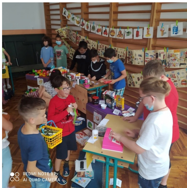
Obr. 12 – English market

Weihnachtsbotschaft- ve spolupráci s vyučujícími HV, AJ, ŠpJ a RJ byl vytvořen video-vánoční pozdrav pro partnerskou školu. Německá škola zaslala na oplátku svůj Digitaler Adventskalender a také videopozdrav.