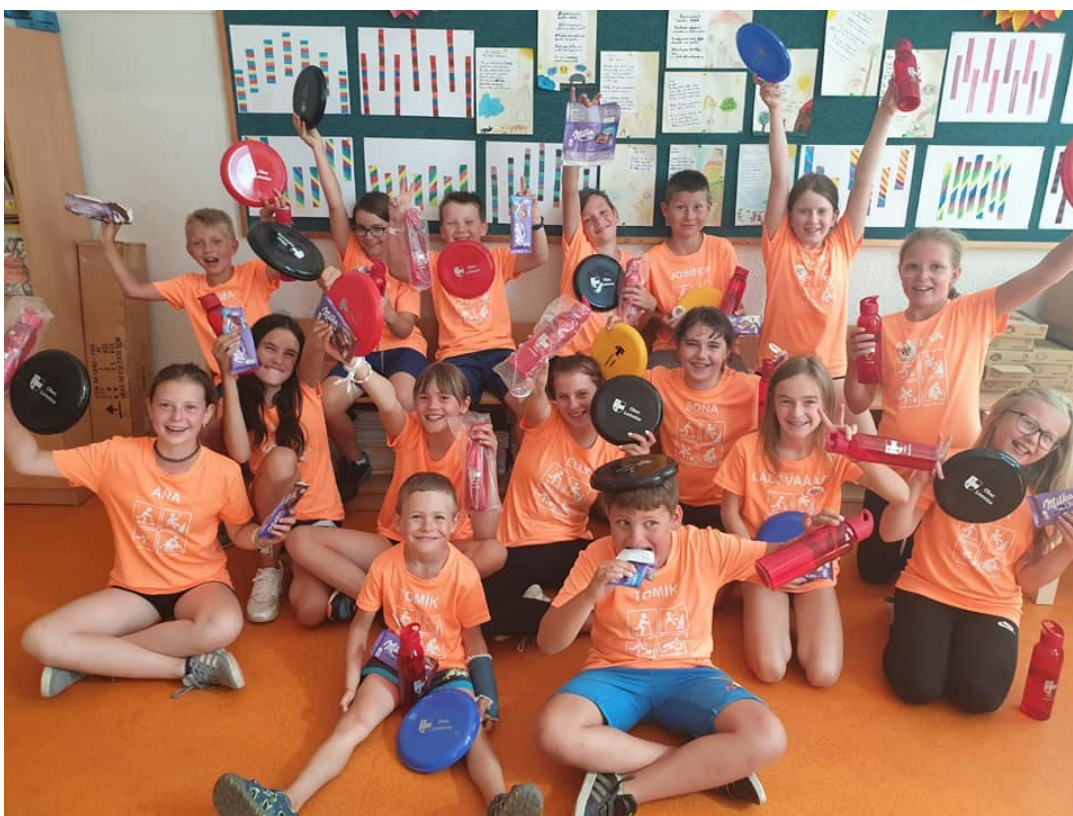
Obr. 3 – Příměstský tábor Týden plný sportu