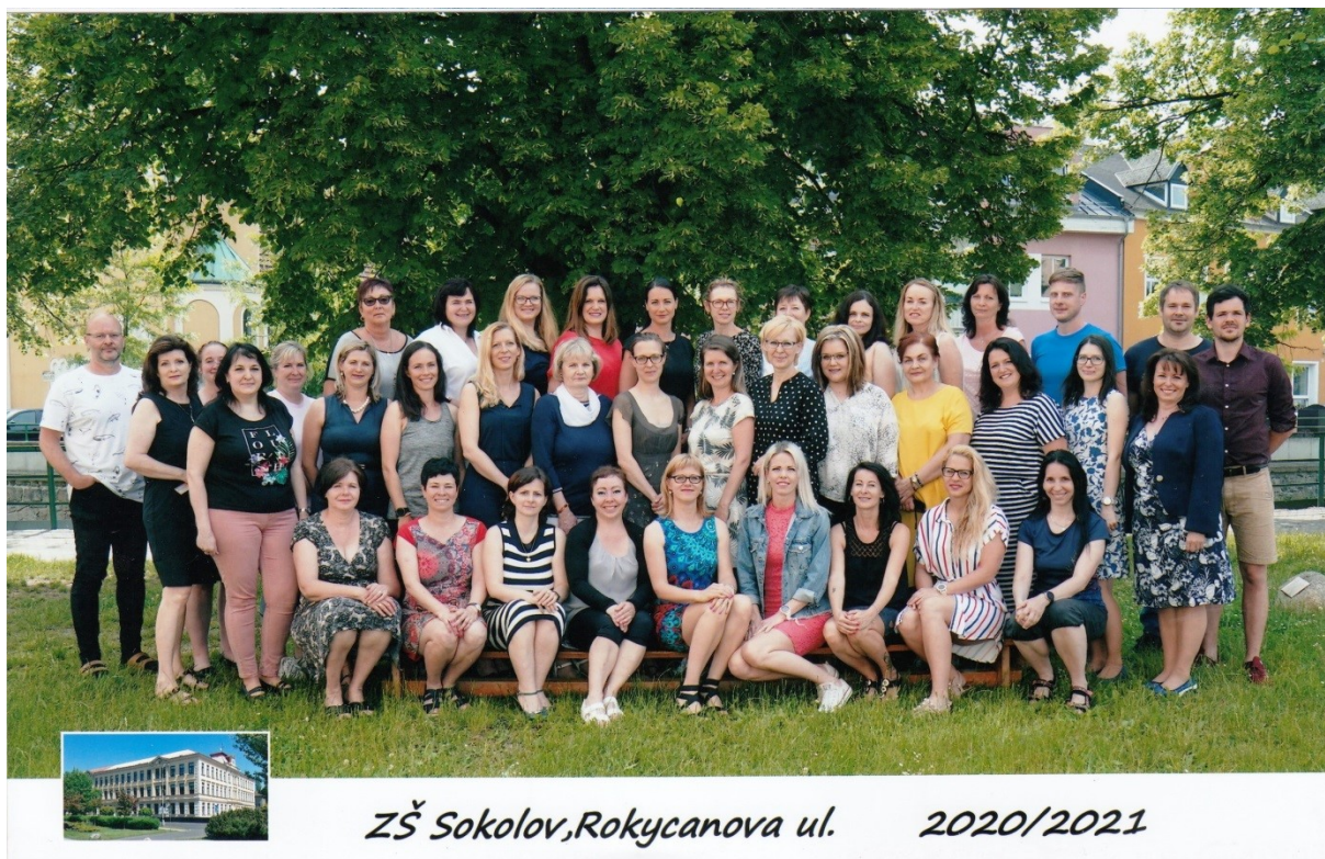
ZŠ Sokolov, Rokycanova ul. 2020/2021

Komentář k tabulce – 1 nekvalifikovaná vyučující splňuje podmínky pro vykonávání přímé pedagogické práce podle § 32, odstavce a), zákona č. 563/2004 Sb., o pedagogických pracovnících. 3 nekvalifikované vyučující s jiným oborem VŠ studia absolvovaly v květnu 2021 DPS, 1 vyučující s jiným VŠ oborem dokončuje DPS, 1 vyučující podával přihlášku na VŠ pedagogického směru. 5 asistentek pedagoga pro žáky se zdravotním znevýhodněním má předepsanou kvalifikaci (středoškolské vzdělání s maturitou a kurz asistenta pedagoga).