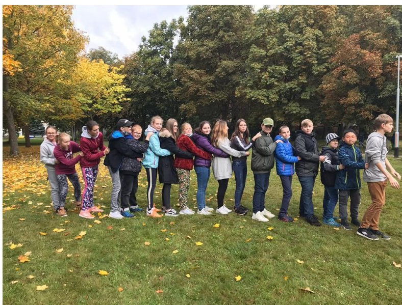
Obr. 13 – Adaptační kurz Odyssea v 6. ročníku