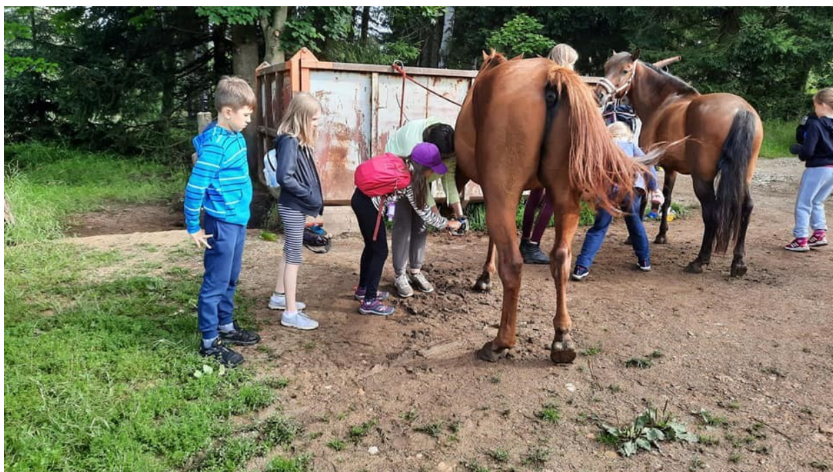
Obr.15 – Letní pobytový tábor na Bublavě

Provozní rozpočet od zřizovatele – města Sokolov 4 100 400 Kč