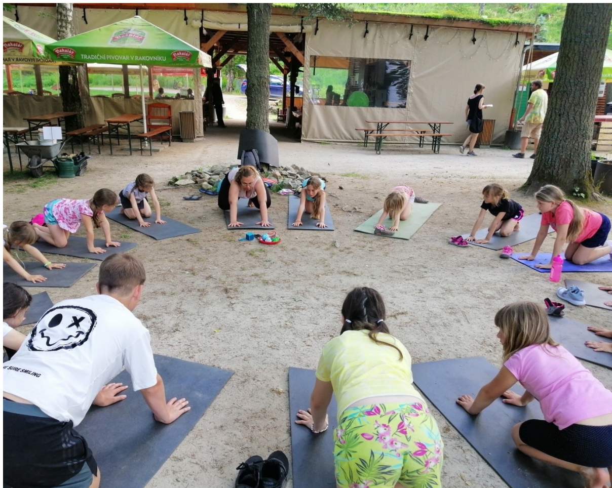
Obr.6 – Jóga v přírodě v rámci šablony Projektový den mimo ŠD (Bečovská botanická zahrada)

V průběhu celého školního roku 2020/2021 fungoval Čtenářský klub financovaný z projektu Moderní škola II.