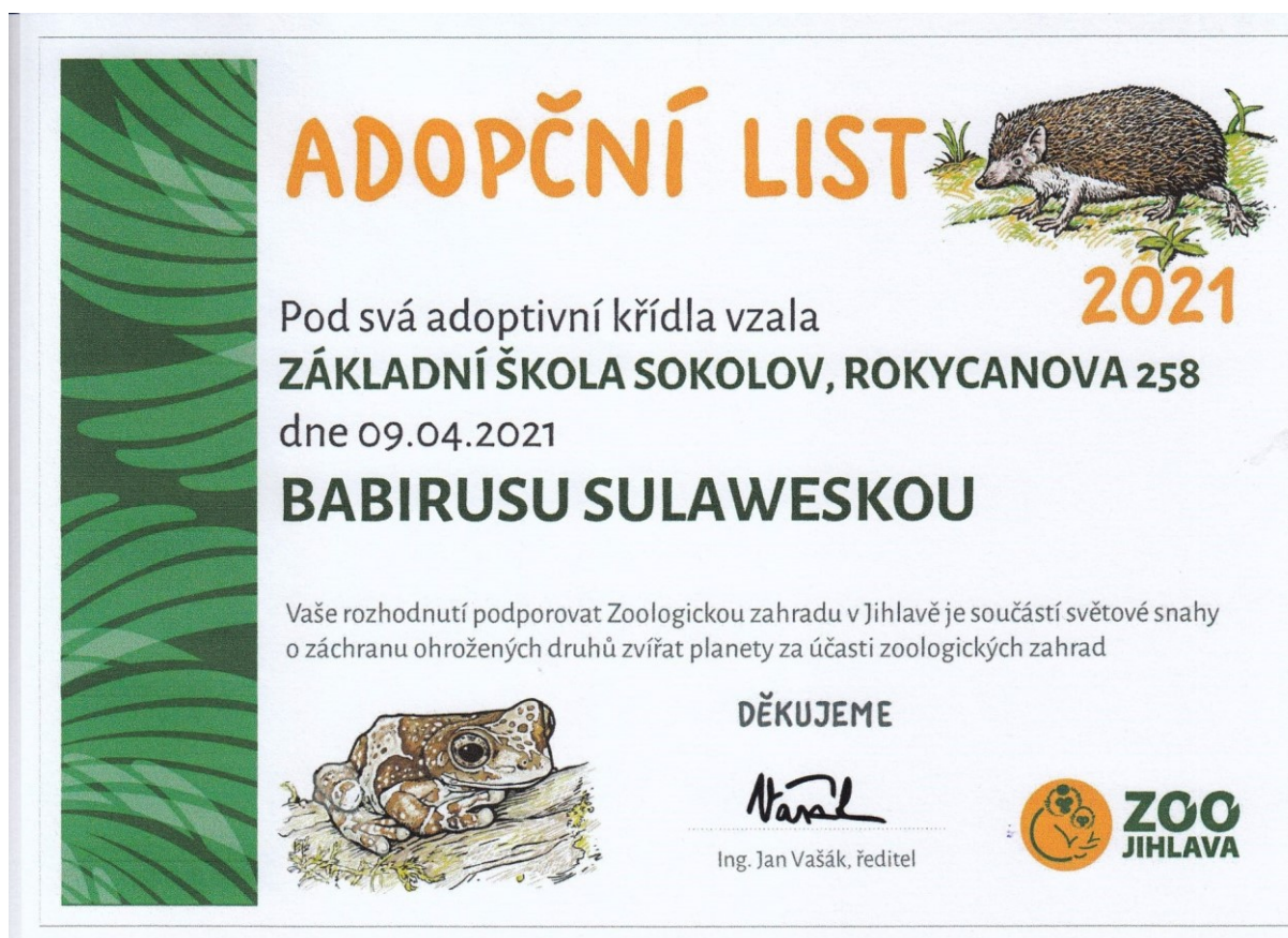
Obr. 1 – Adopce babirusy sulaweské z výtěžku akce ZPRCHA

Vzhledem k tomu, že jsou na naší škole třídy s rozšířenou výukou jazyků, podstatná část žáků dojíždí do školy z okolních obcí a měst. Ve školním roce 2020/2021 dojíždělo do školy 243 žáků.