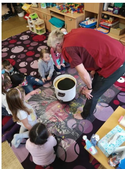
Obr. 8 – Výroba svíček ze včelího vosku v ŠD