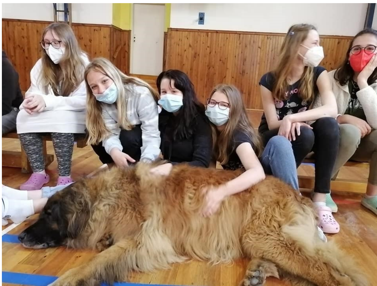
Obr. 2 – Canisterapie v rámci šablony Projektový den ve škole

Velmi kladně hodnotily šablony vychovatelky ve školní družině. Díky výběru šablony – Projektové dny v ŠD a mimo ŠD – mohly s dětmi realizovat celou řadu opravdu zajímavých setkání a výjezdů v míře, která by bez této podpory nebyla možná. Rovněž semináře a kurzy DVPP, které si vybíraly dle potřeb svých i školy přinesly spoustu nových nápadů a způsobů práce.