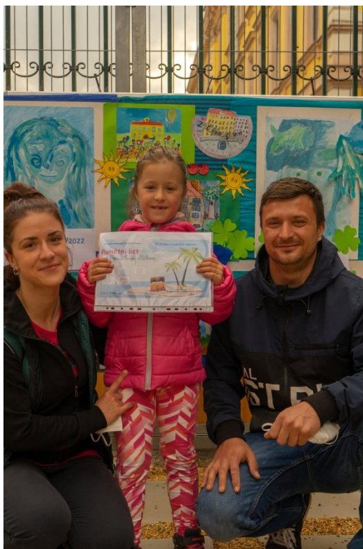
Obr. 9 – Náhradní zápis pro prvňáčky formou únikové hry

Informativní setkání vedení školy, vyučujících 1. stupně a rodičů týkající se nástupu do 1. ročníků se uskutečnilo 22. června.