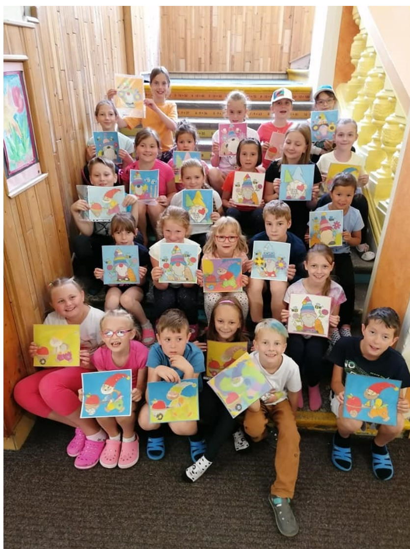
Obr. 5 – Příměstský tábor Tvořílek na cestách

1 učitelka byla ve školním roce na rodičovské dovolené.