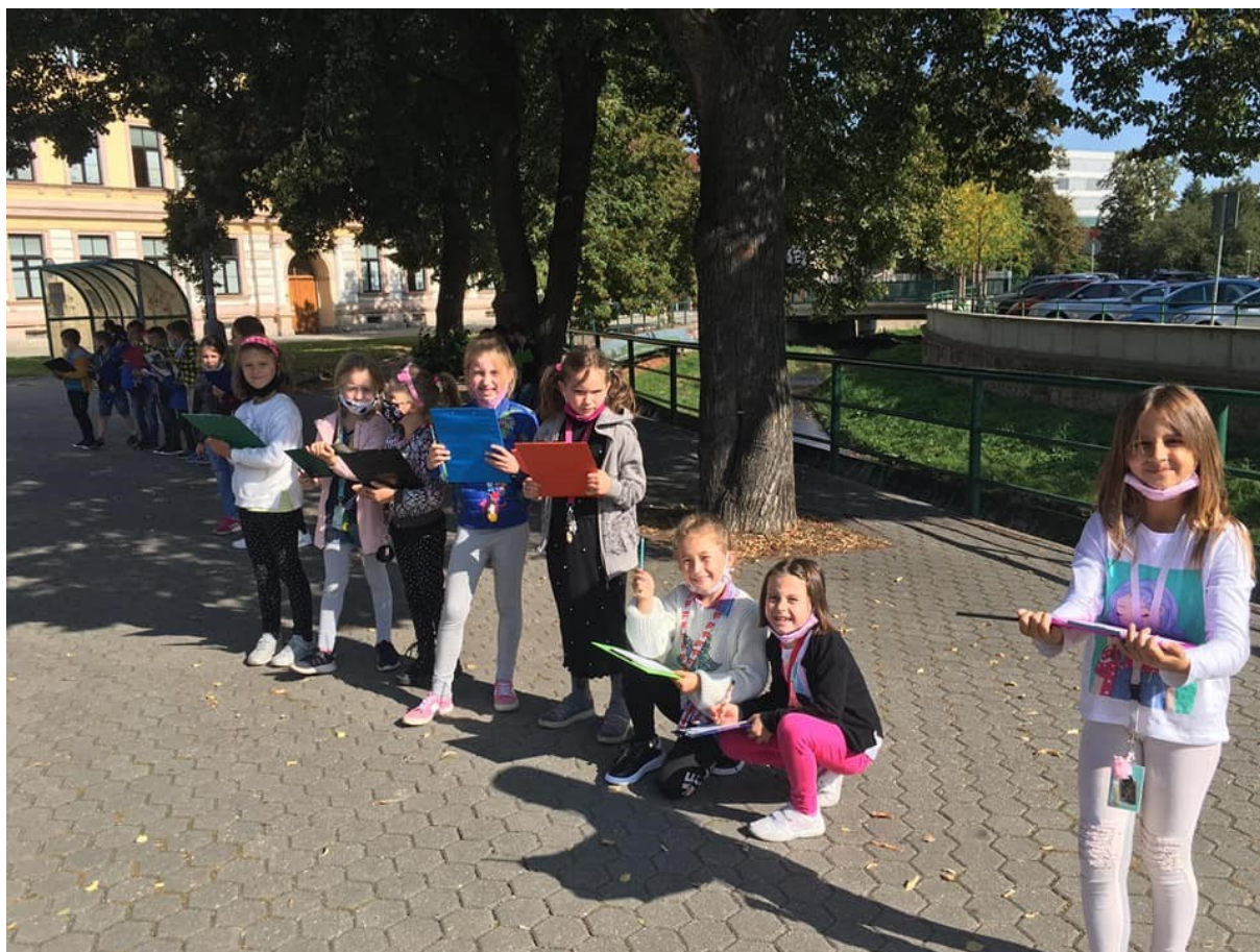
Obr.11 – Environmentální výchova – Den bez au (22. 9. 2020)

Prezentujeme činnosti školy v oblasti environmentální výchovy na internetových stránkách školy a Facebooku školy.